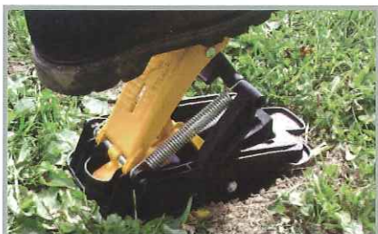
Armement du piège sans utilisation des mains