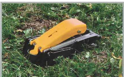
Piège avec profil étudié