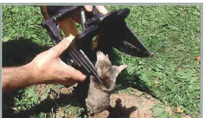
Le piège peut être utilisé encore et encore